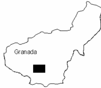
Figura 1. Localización del área de estudio. Figure 1. Study area ubication.

término municipal de Padul en Granada (coordenadas UTM 438659-4098079, Figura 1). La primera observación de alondra de Dupont en la zona tuvo lugar en 1998 en el centro de una gran mancha de matorral de bajo porte situado en el sector norte de dicha altiplanicie (Martín-Vivaldi et al. , 1999). Dado que el relieve de la meseta delimita de forma muy clara una planicie donde existen varias manchas de hábitat potencial inmersas en una matriz de cultivos, todas las visitas realizadas posteriormente se han circunscrito a los límites del altiplano y algunas lomas adyacentes (área de estudio en la Figura 2).