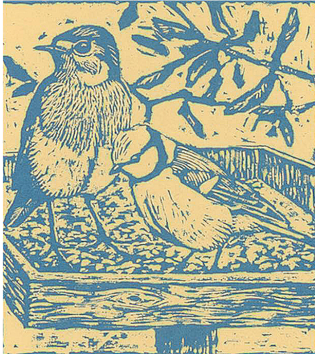
Dibujo: Juan Varela

Los comederos son muy útiles cuando la comida no es abundante, es decir, entre octubre y abril. Al final del invierno, la aparición de numerosos insectos y yemas en los árboles es un buen indicador para que dejes de alimentar a los pájaros. El comedero puede permanecer en su sitio todo el año, aunque es conveniente resguardarlo de la intemperie durante el verano, hecho que prolongará su vida. Si deseas seguir alimentando a los pájaros durante la primavera y el verano, puedes hacerlo, ya que esto no les dañará, siempre y cuando evites los alimentos duros.